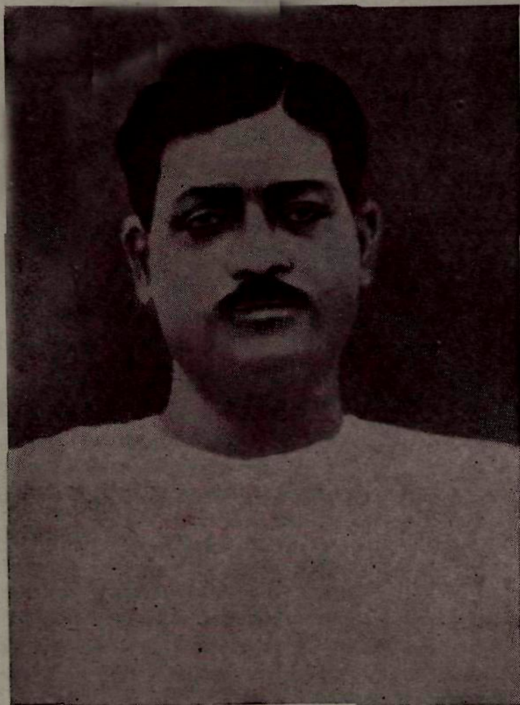
ସୁର୍ଗୀୟ କବି କୃଷ୍ଣମୋହନ