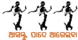
ଆସନ୍ତୁ, ପାଦେ ଆଗେଇବା