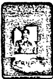
ଉତ୍ତର ଚିନ୍ତନ (ଉପେକ୍ଷା ପୁସ୍ତକ) ଉପେକ୍ଷା ପୁସ୍ତକ