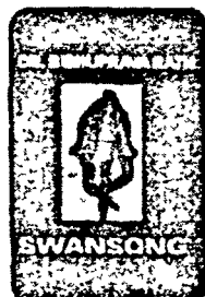
Poetry Collection Published by SWANSONG 1, Lane 4, Gurgaon, India 2000 Price Rs. 100/-