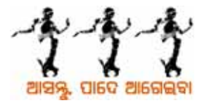
ଆସନ୍ତୁ ପାଦେ ଆଗେରବା