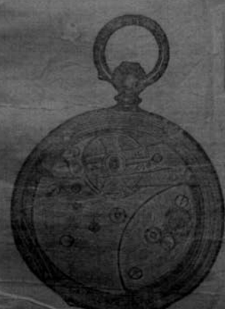
ଓଡ଼ିଆ ଏଣ୍ଡ ବୋ ଉପଦେଶ