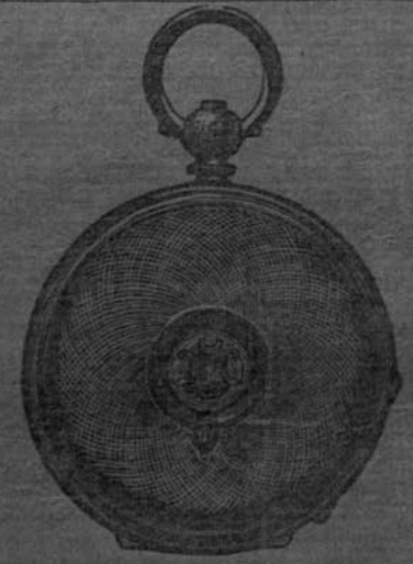
WEST END WATCH Key winding Lever watch full jewelled Guaranteed for four years

Manager Spermatine Depot No. 22 Baranasi Ghose's street Calcutta. ମାଟିକର ଶାରମାଟିକ ଦୋ ଟ ୨୨ ସର ବାଦନ ଗୋଷ୍ଠି କଲକତା