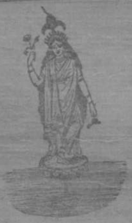
ସମାପ୍ତି ପ୍ରକାର ।

ବହୁମୁଖ ଓ ଧୂଳିରାଜ୍ୟ ସେନାର ମହୋଦୟ ଏକପ୍ରକାରରେ ସମସ୍ତ ଅବଗତ ଦେଖି ପାରି ବେ ହି ତ ନି ୧୯୧୮ ।