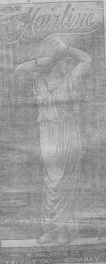
W. MAJOR & CO. CALCUTTA & BOMBAY.

କେତେ ପଦପେ ପଦ, ପଦକର୍ତ୍ତବ୍ୟ ଓ ଶ୍ରୀମନ୍ତାପନକାୟ ମନୋହର କେତେ ଚୈତ୍ୟ । କେତୋଟି କେତେକଗଣାନି ସଦା ପ୍ରାଣେ ସୁଖେପୁରୁ, ଅନ୍ୟାନ୍ୟ ସୁଖର ସ୍ଵାଦ, ଦୈର୍ଘ୍ୟ ଓ ଫୁଲରେ ବଦନିତ କର ଦେଖିବ କେତେ ଯୋଗ୍ୟ ଦୈନିକ ସଂଗୋଷ୍ଠରେ ଏହି ଦେହାବ-ଲାଇନ ପ୍ରସ୍ତୁତ ହୋଇ-ଅଛି । ଅପର ବଡ଼ ଲୋକଦାୟ ଅରମ୍ଭ କରନ୍ତୁ, ଅପର ଶୋଭାରେ ଘରପଡ଼ି ମହତ୍ତ୍ଵ ପ୍ରଦ । ମୁଖ୍ୟ ସୁଖୀର କେତେ । କିମ୍ପା ଘେନି ମନୋହର ସୁଖରେ ମୁଗ୍ଧ ହେବେ । ଅପରଫଳ ମନେ ହେବ ଯେପରି ପ୍ରାଣେ ପୁଣି ଯତ୍ୟାତ୍ୟ ଅଧିକରୁ ।