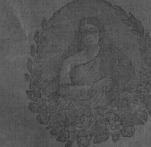
ଉତ୍କଳଦିପିକାରେ ବିଶେଷ ଦ୍ରବ୍ୟମା ପୂର୍ବ ସମ୍ପାଦନା

A graduate or a trained F. A., with a fair knowledge of Uriya, for the post of Head master, Sri Rajas' Secondary School, Dharakota, Salary Rs 50 per mensem. Preference will be given to an Uriya candidate. Apply with testimonials to The Hon'ble the Raja of Dharakota, P. O. Dharakota Ganjam District.