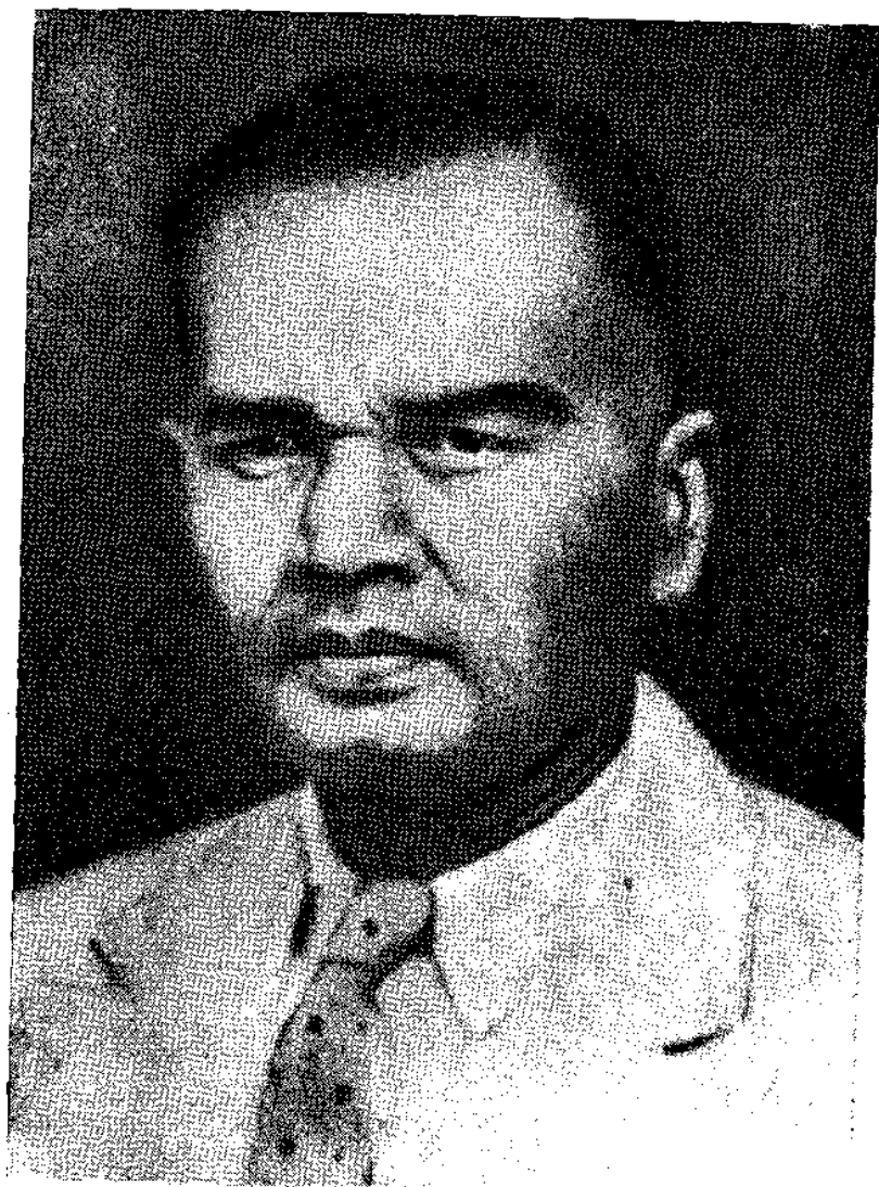
କବି ବୈକୁଣ୍ଠନାଥ ପଟ୍ଟନାୟକ