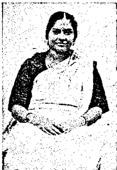
ଉତ୍କଳଭରଣୀ କୁଞ୍ଜଳକୃପାଚାର୍ଯ୍ୟ (୧୯୨୮)