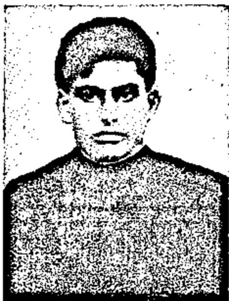
କୁଟନାକୁମାରୀ ମଧୁସୂତ୍ର କୋଠିରେ ଦେଖିଥିବା ଜିଣେଇ ।