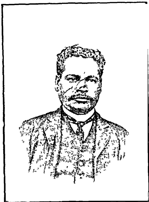
ଦେଶପ୍ରାଣ ନରସିଂହ ଦାସ