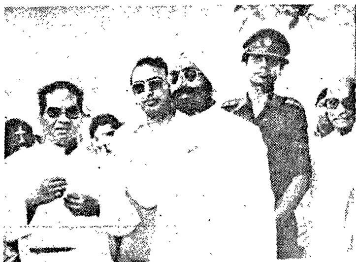
ଭାରତର ତତ୍କାଳୀନ ରାଷ୍ଟ୍ରପତି ଜ୍ଞାନା କୈଳେ ସିଂହଙ୍କ ସହ ତତ୍କୃର ସାହୁ