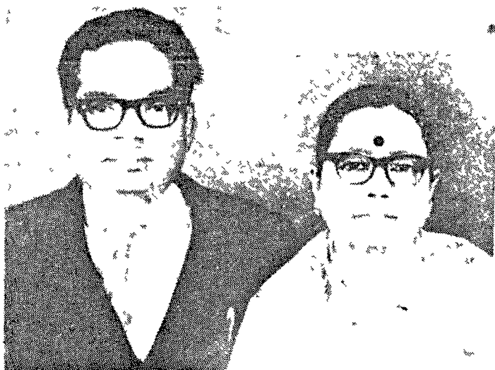
ଡକ୍ଟର ସାହୁ ଓ ଶ୍ରୀମତୀ ସାହୁ