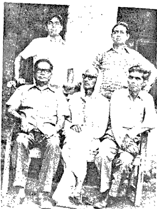
ବାପା ଓ ଭାଇମାନଙ୍କ ଗହଣରେ ତତ୍କୃର ସାହୁ