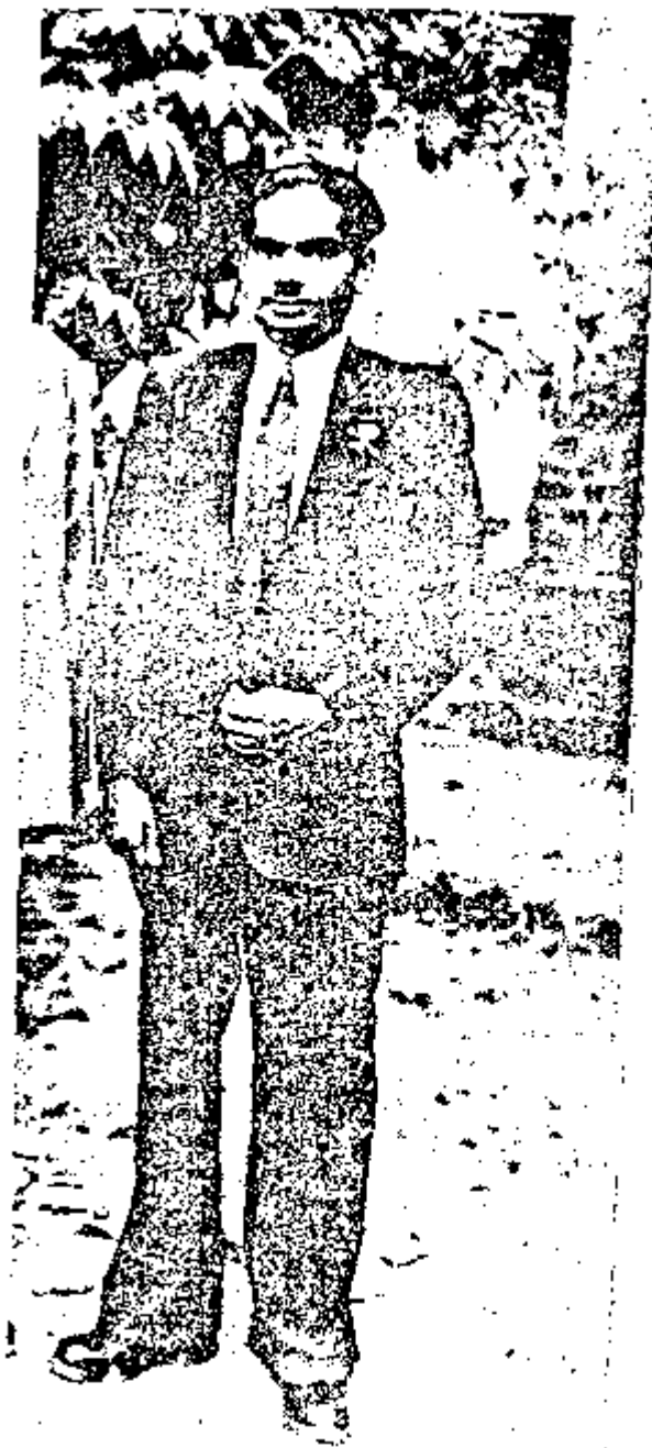
ପ୍ରଥମ ମହାବିଦ୍ୟାଳୟରେ ଅଧ୍ୟାପକ ଭବିଷ୍ୟତ ବାହୁ