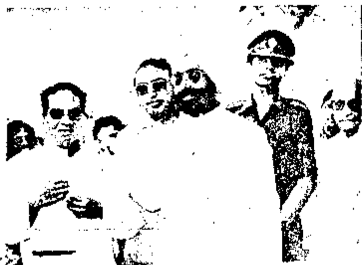
ଭାରତର ଡକ୍ଟରମାନ ଗାଣ୍ଡୁପଡ଼ି ଛାନା ଚୈନ ସିଂହଲ ସହ ଡକ୍ଟର ସାହୁ