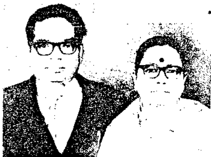
ଡକ୍ଟର ସାହୁ ଓ ଶ୍ରୀମତୀ ସାହୁ